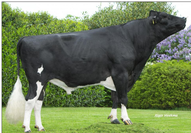
MALKI NL 000740466834 - né le 27/03/2012 - N° d'agrément 91272