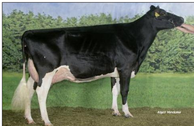
Mère de MALKI : BIG ANNA JACOBA 115 (EX 90)

MALKI est conseillé sur la plupart des vaches laitières excepté sur les filles de Basman et Sentaro.