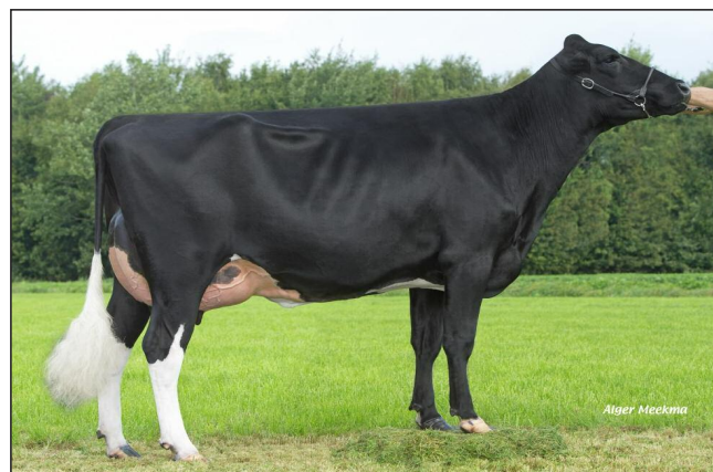
Fille de MALKI : JESSIE 43