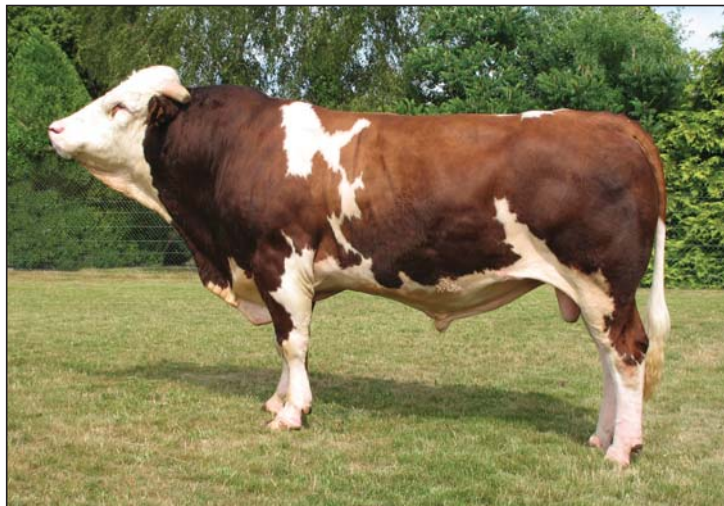
ALCAZAR FR 2531 083104 - né le 22/09/2005 - N° agrément 76034