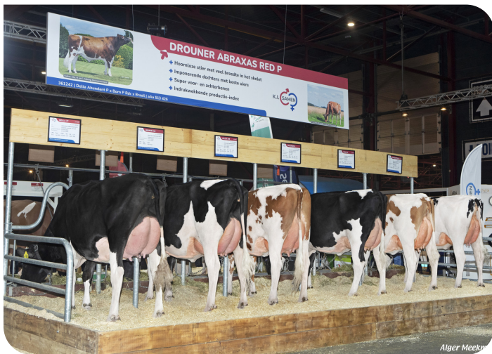
Groupe de filles de Abraxas Red P HHH Leeuwarden 2025