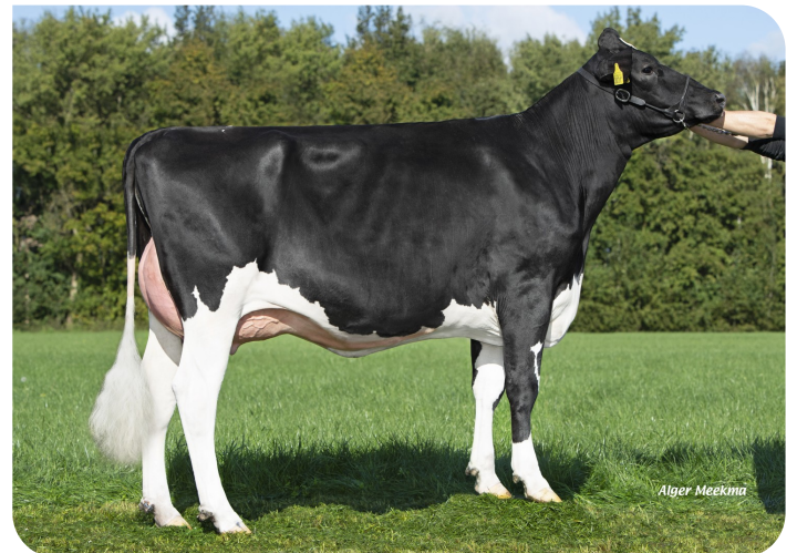
Grashoek Jettie 248 (p. Abraxas Red P) Prop.: Fok- en melkveebedrijf K.I. Samen B.V., Grashoek (NL)